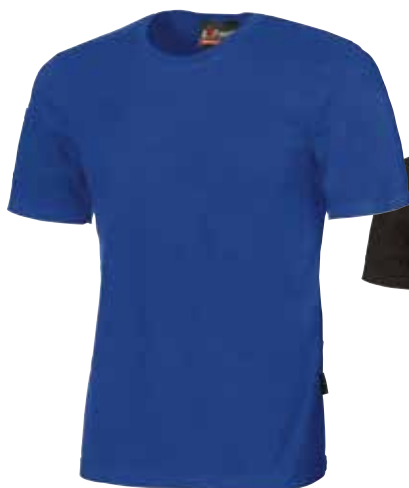
code EY044BT col. BLUE COBALT