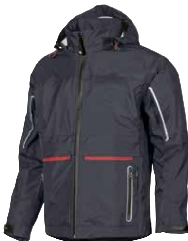
code SY007MB col. MIDNIGHT BLUE