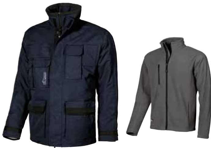
code IM014DB col. DEEP BLUE