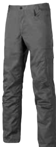
code ST069GM col. GREY METEORITE