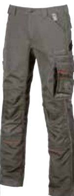
code IM010SG col. STONE GREY