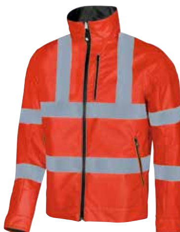
code HL066RF col. RED FLUO