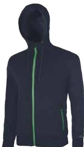
code EY092DB col. DEEP BLUE