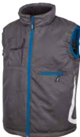
code PE115GB col. GREY BLUE