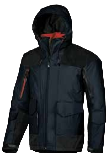
code IM013DB col. DEEP BLUE