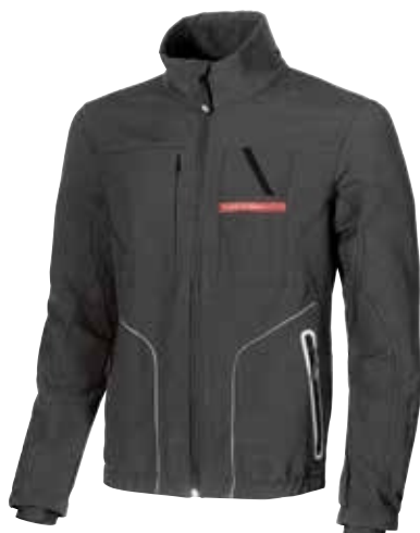
code SY009GM col. GREY METEORITE