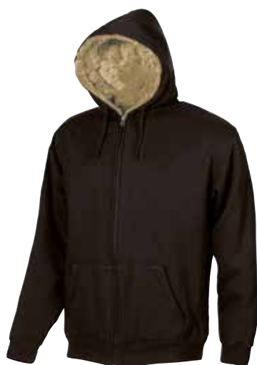
code EY038CB col. CREME BRULEE