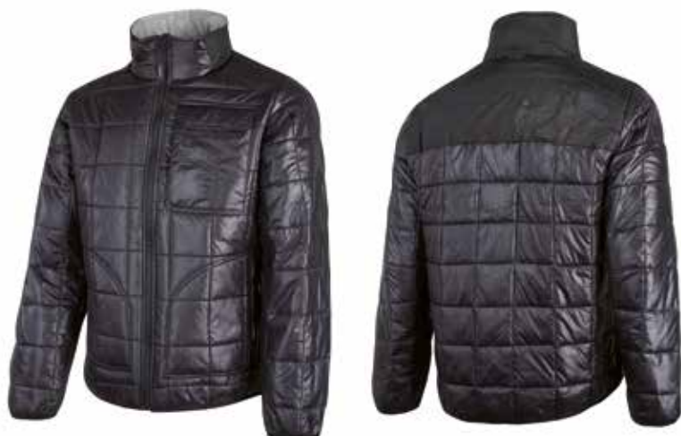
code EX088BC col. BLACK CARBON