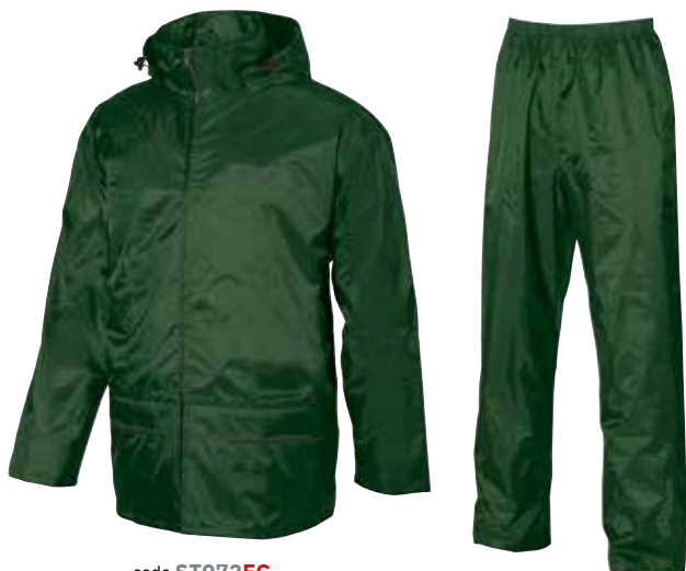
code ST072FG col. FOREST GREEN