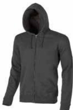
code EY037GM col. GREY METEORITE