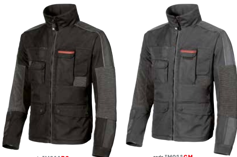
code IM011BC col. BLACK CARBON