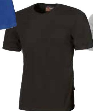
code EY044BC col. BLACK CARBON