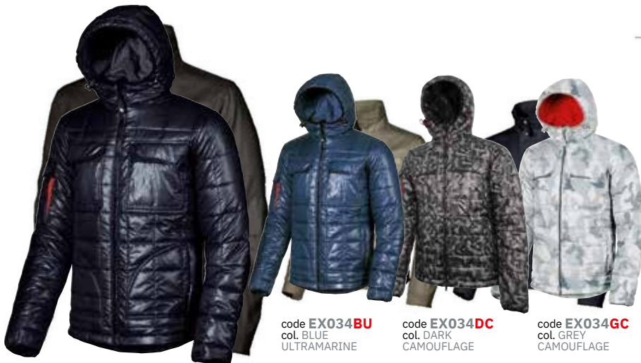
code EX034BP col. BLUE POWER