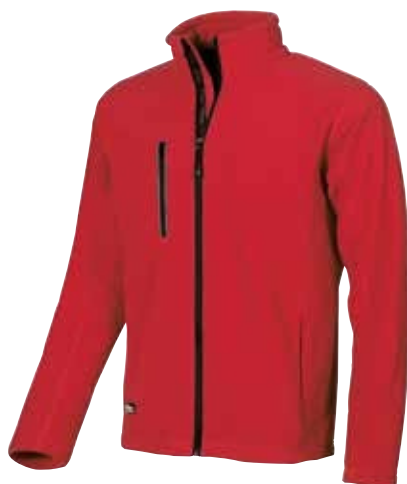
code EY040RM col. RED MAGMA