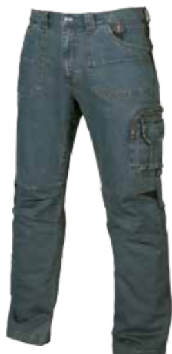
code UP076RJ col. RUST JEANS