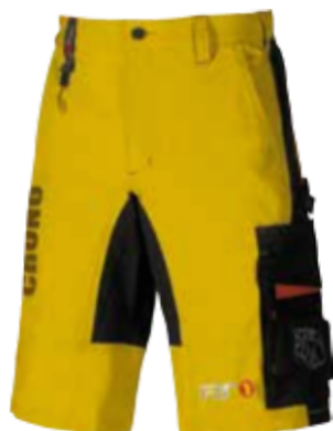
code UP087YP col. YELLOW PEPITA