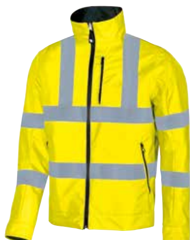
code HL066YF col. YELLOW FLUO