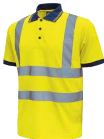
code HL166YF col. YELLOW FLUO