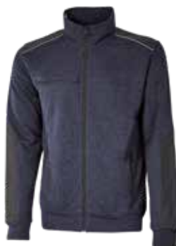
code EY122DB col. DEEP BLUE