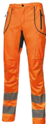
code HL186OF col. ORANGE FLUO