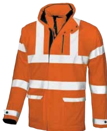
code HL065OF col. ORANGE FLUO