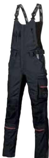
code SY006DB col. DEEP BLUE