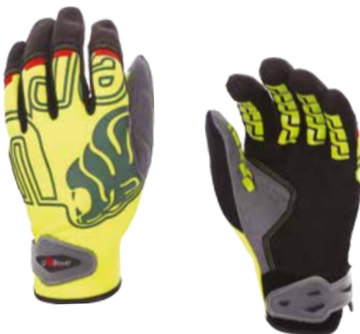
code GP105YF col. YELLOW FLUO