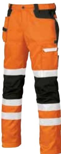
code HL074OF col. ORANGE FLUO