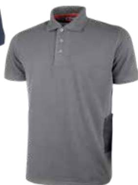
code EY191GM col. GREY METEORITE