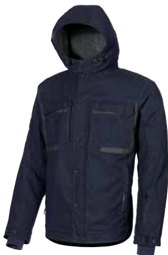
code EX035DB col. DEEP BLUE