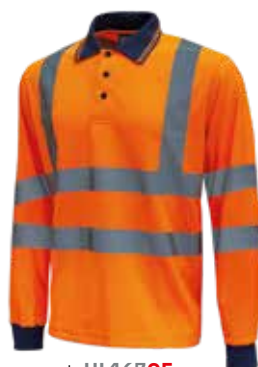
code HL167OF col. ORANGE FLUO