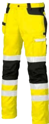
code HL074YF col. YELLOW FLUO