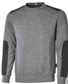
code EY120GM col. GREY METEORITE