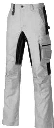
code PS079ZG col. ZINC GREY