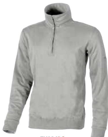
code EY036LG col. LIGHT GRANITE