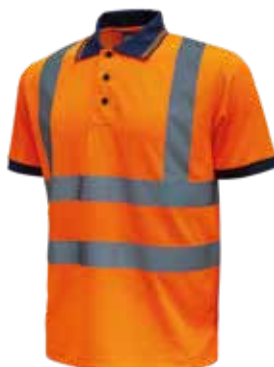
code HL166OF col. ORANGE FLUO