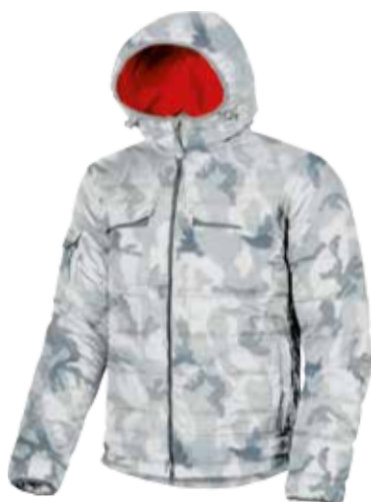
code UP077GC col. GRYE CAMOUFLAGE

PIUMINO DOTATO DI 2 TASCHE SU PETTO CON CHIUSURA A VELCRO