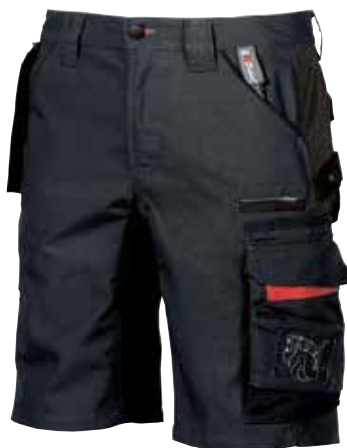
code SY003DB col. DEEP BLUE