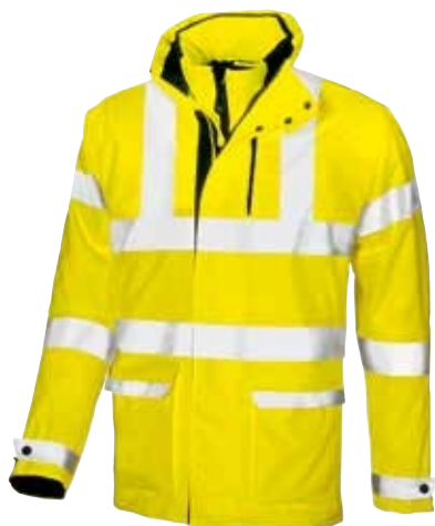
code HL065YF col. YELLOW FLUO