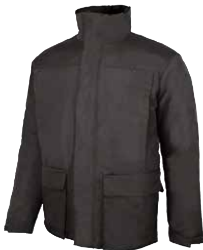
code ST090GM col. GREY METEORITE