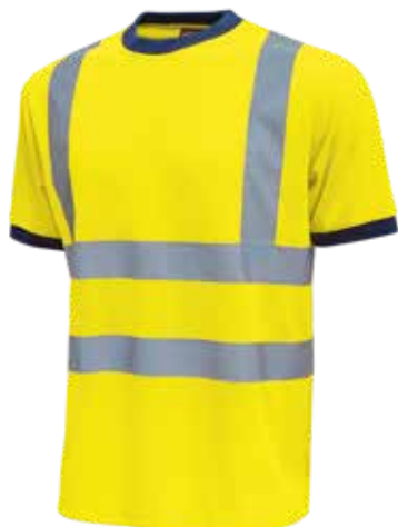
code HL165YF col. YELLOW FLUO