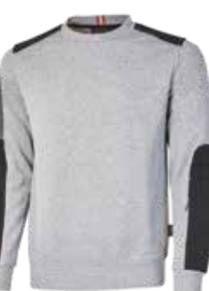
code EY120GS col. GREY SILVER