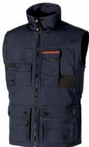
code SY004DB col. DEEP BLUE