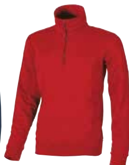
code EY036RM col. RED MAGMA