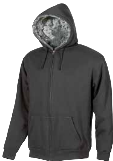
code EY038GM col. GREY METEORITE