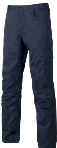
code ST069DB col. DEEP BLUE