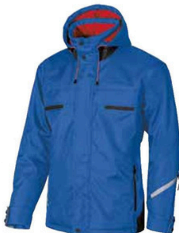
code DW026BN col. BLUE NEON