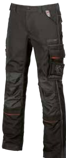
code IM010BC col. BLACK CARBON