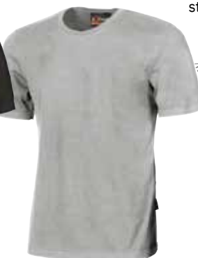
code EY044LG col. LIGHT GRANITE