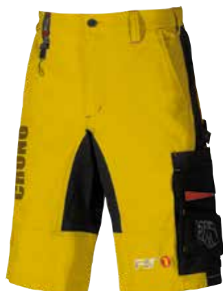
code PS080YP col. YELLOW PEPITA