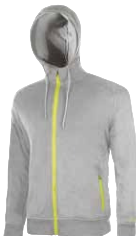
code EY092LG col. LIGHT GRANITE