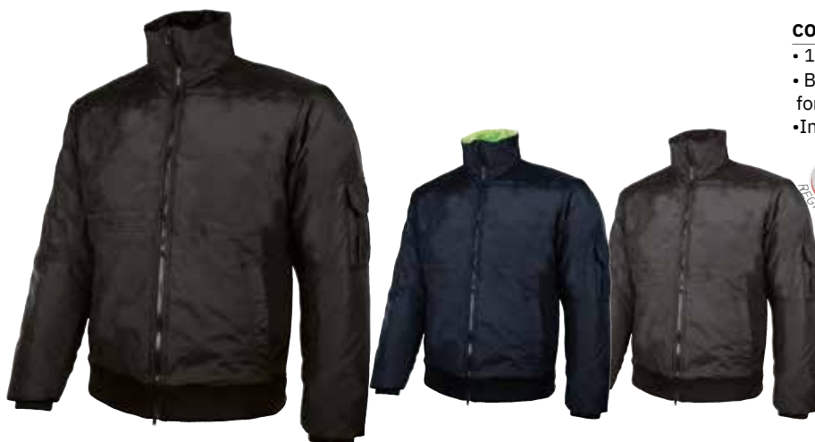
code ST091BC col. BLACK CARBON