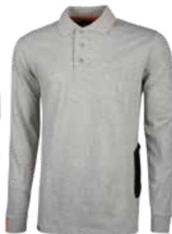
code EY194GS col. GREY SILVER