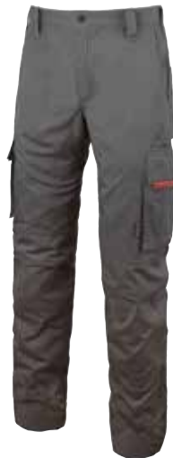
code HY106GM col. GREY METEORITE