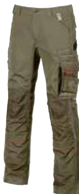
code IM010DS col. DESERT SAND