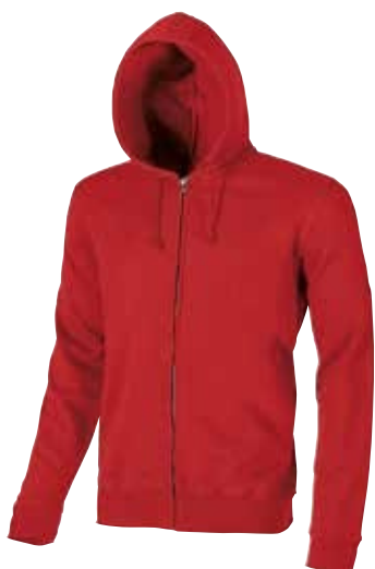
code EY037RM col. RED MAGMA