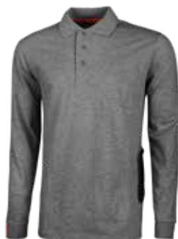
code EY194GM col. GREY METEORITE