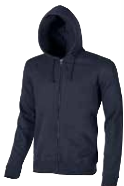
code EY037DB col. DEEP BLUE