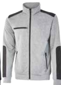
code EY122GS col. GREY SILVER