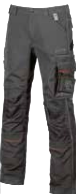
code IM010GM col. GREY METEORITE