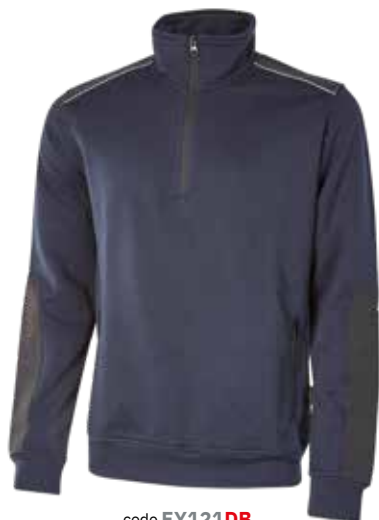
code EY121DB col. DEEP BLUE