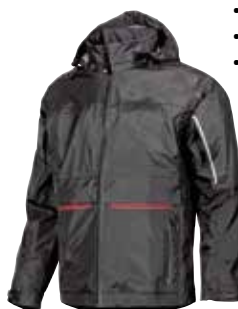
code SY007GM col. GREY METEORITE