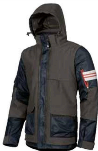
code EX033DB col. DEEP BLUE

COMPOSIZIONE GIUBBOTTO: 100% NYLON PONGEE 320T + PU COATING GILET ESTERNO: 96% POLIESTERE • 4% ELASTANE