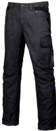
code EX027WB col. WESTLAKE BLUE