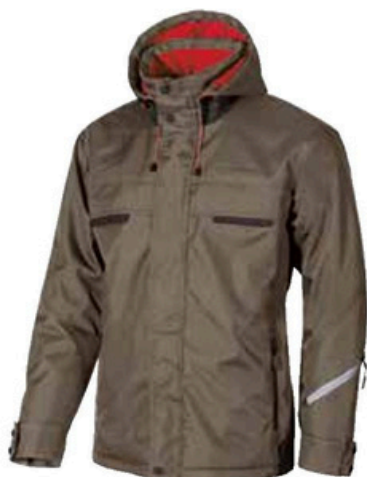
code DW026MT col. MUD TITANIUM