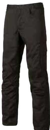
code ST069BC col. BLACK CARBON