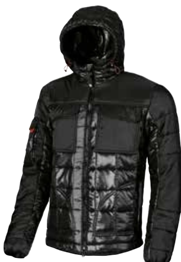
code EX064BC col. BLACK CARBON