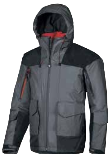
code IM013GM col. GREY METEORITE