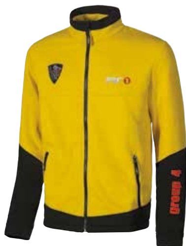
code PS082YP col. YELLOW PEPITA