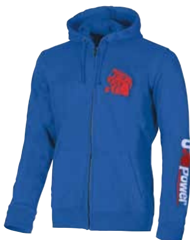
code EY039BN col. BLUE NEON