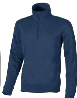
code EY036IB col. INDIGO BLUE