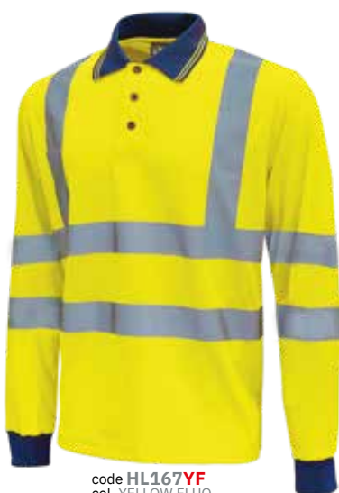
code HL167YF col. YELLOW FLUO