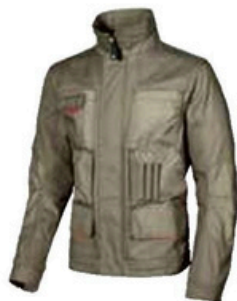
code DW023DS col. DESERT SAND