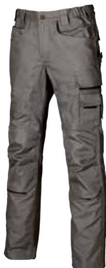
code DW022SG col. STONE GREY