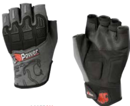
code AC055GM col. GREY METEORITE