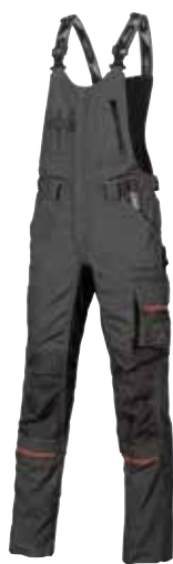
code SY006GM col. GREY METEORITE