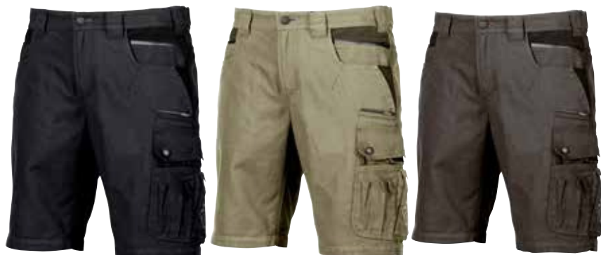
code EX028WB col. WESTLAKE BLUE