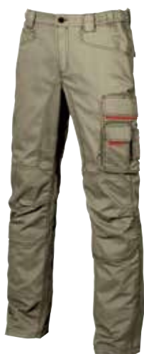
code HY015DS col. DESERT SAND