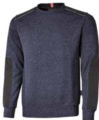
code EY120DB col. DEEP BLUE