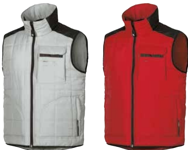
code EX032GP col. GREY PALLADIUM