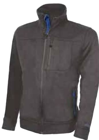
code EY093GM col. GREY METEORITE