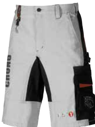
code PS080ZG col. ZINC GREY