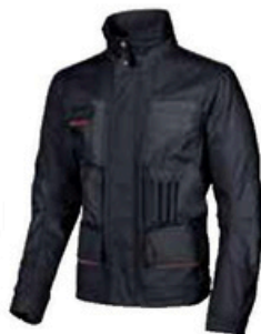
code DW023DB col. DEEP BLUE

COMPOSIZIONE • 60% COTONE • 40% POLIESTERE • TWILL 300 gr/m2