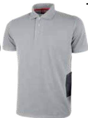
code EY191GS col. GREY SILVER