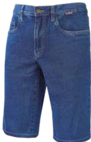
code ST117GJ col. GUADO JEANS