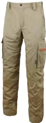
code HY106DS col. DESERT SAND