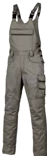
code HY020SG col. STONE GREY