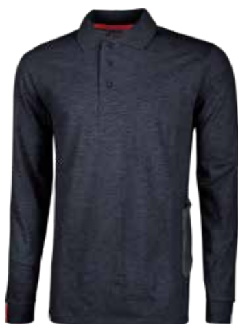
code EY194DB col. DEEP BLUE