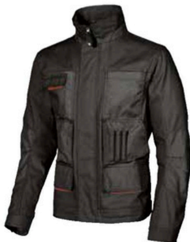
code DW023BC col. BLACK CARBON