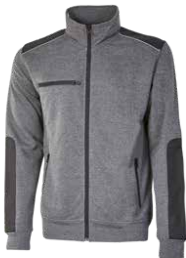
code EY122GM col. GREY METEORITE