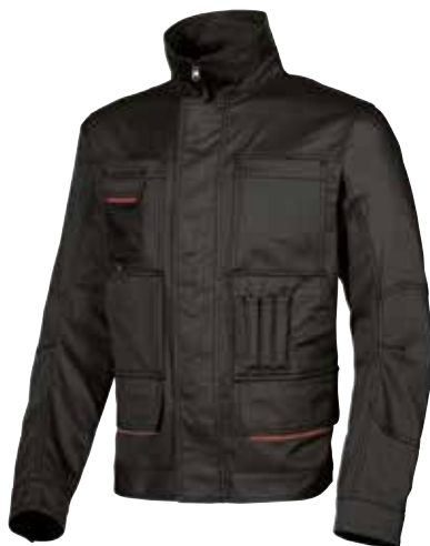
code HY019BC col. BLACK CARBON