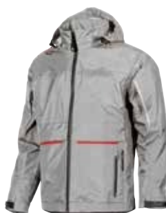
code SY007GP col. GREY PALLADIUM