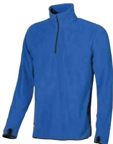
code EY041BN col. BLUE NEON