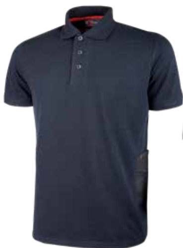
code EY191DB col. DEEP BLUE