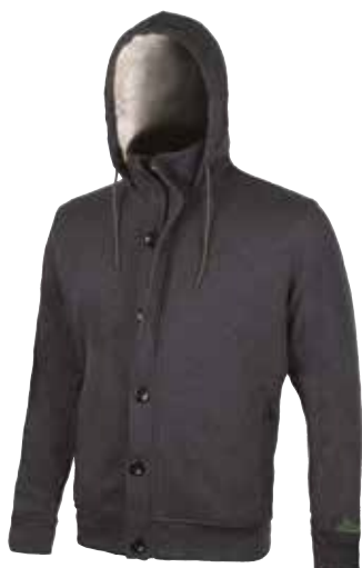
code EY094GM col. GREY METEORITE