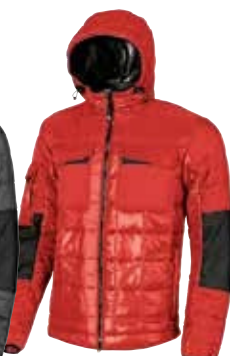
code EX064RM col. RED MAGMA