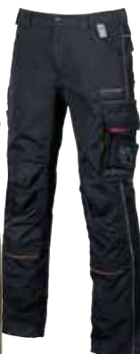
code IM010DB col. DEEP BLUE