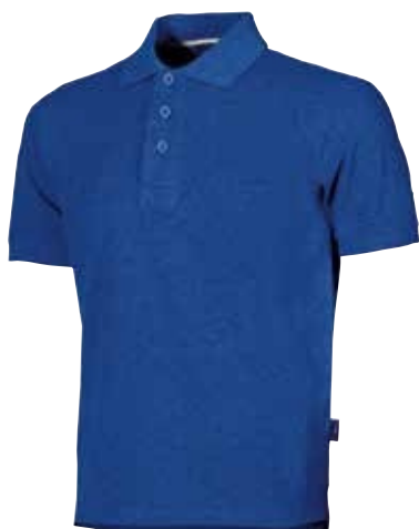
code EY043BT col. BLUE COBALT