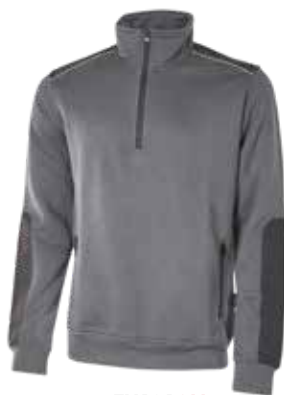
code EY121GM col. GREY METEORITE