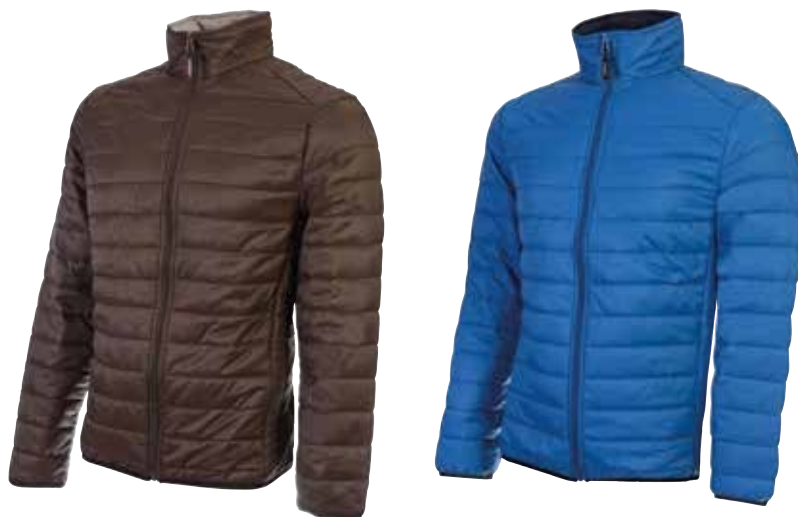
code ST089CH col. CHOCOLATE