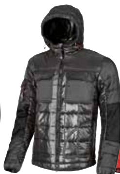
code EX064GL col. GREY LEAD