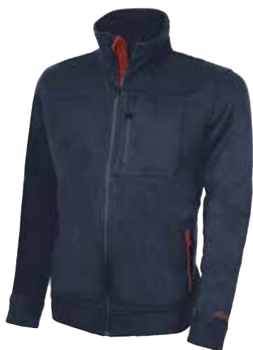
code EY093DB col. DEEP BLUE