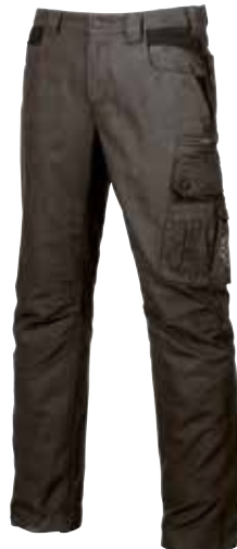
code EX027GI col. GREY IRON