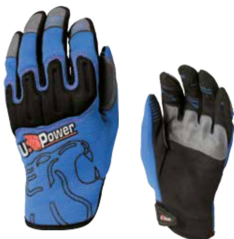
code AC053BN col. BLUE NEON